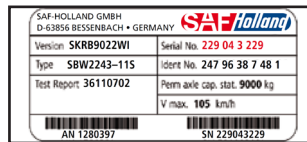
Abb. 2: Ab Mitte 2004