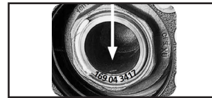
Abb. 3: Typenschild fehlt

Alle Richtzeiten werden laufend nach technischen Erfordernissen aktualisiert. Die Aktualisierungen finden Sie unter: